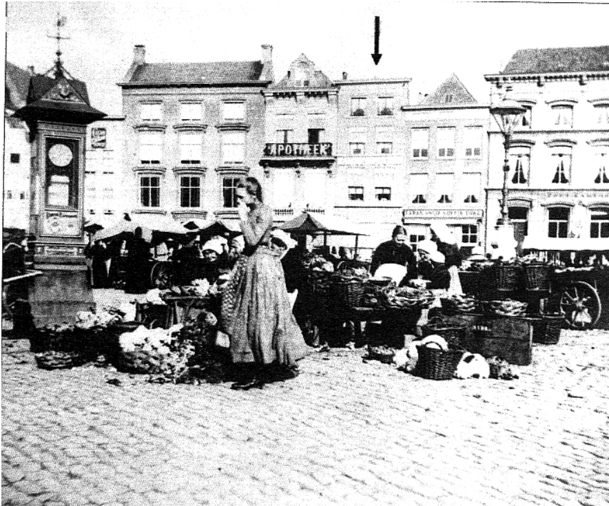
Afb. 2: Een heel bijzondere foto uit ca. 1885 van de wekelijkse markt. Links op de voorgrond een klok met windvaan en rechts een lantaarnpaal 'De Lange Sijn'. Meest rechts het pand waarin thans Hotel Central, maar toen het Postkantoor(!) was gevestigd. Daarnaast een kruidenier. Links daarvan Markt 59: E.L. de Jongh, manufacturen.

Het pand Markt 59 staat bekend onder de naam 'Het vergulde Duifke' (afb. 10). De koopacte van 1752 beschrijft het als 'Een schoon, sterck, en wel ter neering staande huijsinge, met zijn overwulfde kelders, agter met een steene brugge over de diese met een poortje uijtgaande, gestaan ende gelegen binnen deese stad, aan de Gemeene Marckt, gemeenlijk genaamt het Vergult Duijke'.