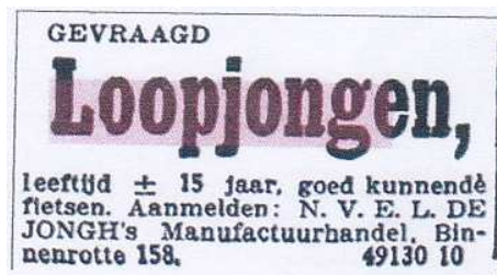
Afb. 5: Adv. 16.9.1929 in het Rotterdamsch Nieuwsblad: E.L. de Jongh zoekt een loopjongen die goed kan fietsen.