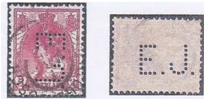
Afb. 1: Perfin E. J. en grootrondstempel 's-Hertogenbosch.

Winkels, net als mensen, komen en gaan. Ze laten over het algemeen niet veel sporen achter. Daarom is het goed dat er archieven zijn. Wat daar binnenkomt wordt gewoonlijk zorgvuldig beschreven, gerubriceerd en opgeborgen. Meestal vinden archiefmedewerkers het prettig om bezoekers van dienst te zijn en de weg te wijzen bij hun speurtocht, al dan niet digitaal, in de vaak kilometerslange rijen archiefmappen. Zo werd het dankzij archieven in 's-Hertogenbosch, Den Haag en Rotterdam mogelijk een verhaal te vertellen over de manufacturenhandel E.L. de Jongh, die zich vanaf 1899 meer dan dertig jaar heeft bedield van de firmaperforatie 'E. J.' (afb.1).